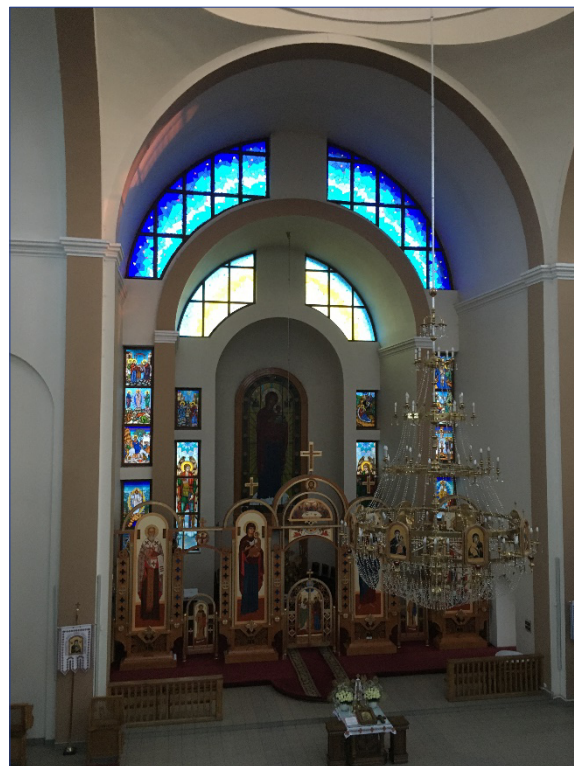
Рис. 3. Интер'єр церкви Матері Божої Неустанної Помочі на бульв. Д. Галицького

Сьогоднішній підхід до влаштування інтер'єрів у великих храмах і релігійно-духовних комплексах передбачає інтегроване поєднання архітектури та мистецтва, які взаємно доповнюють один одного. Якщо шукати вдалих прикладів гармонійного вирішення великих храмових комплексів у сучасному українському сакральному мистецтві, то варто відмітити храм Різдва Богородиці на Сихові у Львові та Спасо-Преображенський собор у Голосієво в Києві. Можна відзначити, що Церква Матері Божої Неустанної Помочі в Тернополі має комплексний підхід до вирішення сакрального простору, тобто до узгодженої гармонізації архітектури, вітражного мистецтва, іконостаса [5, с. 148].