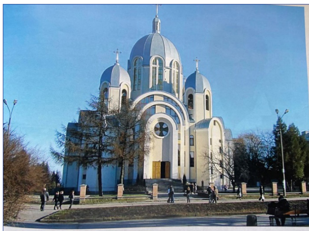
Рис. 1. Церква Матері Божої Неустанної Помочі на бульв. Данила Галицького

Церква Матері Божої Неустанної Помочі (2000 р.) хрестово-купольна в плані, має п'ять шоломоподібних куполів, виконана у візантійському стилі. Три зростаючі від входу піварки, у які вмонтовані вітражні вікна, розміщені на раменах хреста з північного, південного й центрального західного входів, над ними