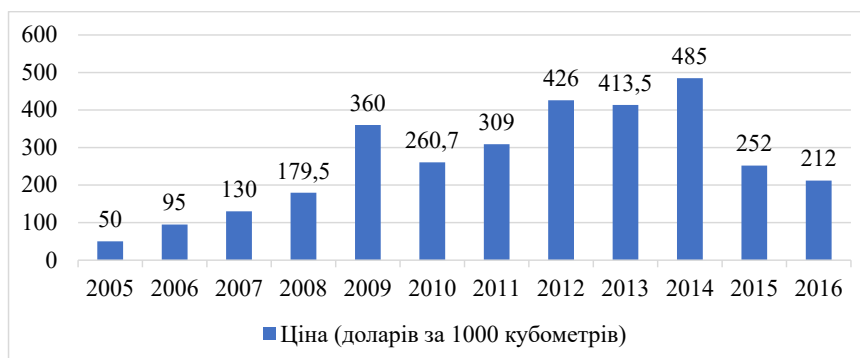
Рис. 1. Динаміка зміни закупівельних цін природного газу для України у 2005–2016 рр. [9]