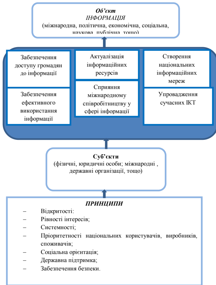
Рис. 1. Узагальнена модель державної інформаційної політики

У своїй праці В. Пожуєв детально розкриває базові принципи інформаційної політики, але не приділяє уваги негативним аспектам цього феномену (Pozhuyev, 2010, p. 8). Проте професор С. Браман, окрім традиційного визначення поняття «інформаційна політика», розкриває його негативні характеристики через аналіз такого феномену нового тисячоліття як інформаційна держава. Зокрема, вона виділяє наступні соціальні впливи нових тенденцій інформаційної політики в інформаційній державі: «Держава «знає» більше все більше і більше про людей, в той час як люди «знають» все менше і менше про саму ж державу. Існує значна відмінність між тим як сприймають суть інформаційної держави представники уряду і громадяни. 2. Використання цифрових інформаційних технологій може скоріш скоротити ніж збільшити можливості розвитку демократичного укладу, що базується на конструктивній участі членів. 3. В той час як цифрові технології могли розширити можливості для участі громадськості у голосуванні шляхом референдуму, сучасні інформаційні технології для голосування знизили рівень впевненості електорату у тому, що їх голоси будуть точно записуватися і зберігатися без маніпуляцій. 4. Індивідуум зникає в інформаційній державі, трансформуючись у «математичну ймовірність». 5. Надання доступу до інформації використовується державою з метою активізації певного переконання. 6. Інформаційна держава володіє значно більшими