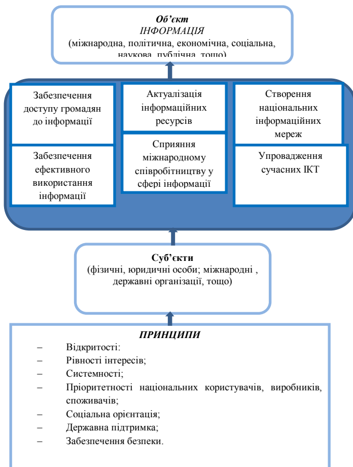
Рис. 1. Узагальнена модель державної інформаційної політики

У своїй праці В. Пожуєв детально розкриває базові принципи інформаційної політики, але не приділяє уваги негативним аспектам цього феномену (Pozhuyev, 2010, р. 8). Проте професор С. Браман, окрім традиційного визначення поняття «інформаційна політика», розкриває його негативні характеристики через аналіз такого феномену нового тисячоліття як інформаційна держава. Зокрема, вона виділяє наступні соціальні впливи нових тенденцій інформаційної політики в інформаційній державі: «Держава «знає» більше все більше і більше про людей, в той час як люди «знають» все менше і менше про саму ж державу. Існує значна відмінність між тим як сприймають суть інформаційної держави представники уряду і громадяни. 2. Використання цифрових інформаційних технологій може скоріш скоротити ніж збільшити можливості розвитку демократичного укладу, що базується на конструктивній участі членів. 3. В той час як цифрові технології могли розширити можливості для участі громадськості у голосуванні шляхом референдуму, сучасні інформаційні технології для голосування знизили рівень впевненості електорату у тому, що їх голоси будуть точно записуватися і зберігатися без маніпуляцій. 4. Індивідуум зникає в інформаційній державі, трансформуючись у «математичну ймовірність». 5. Надання доступу до інформації використовується державою з метою активізації певного переконання. 6. Інформаційна держава володіє значно більшими