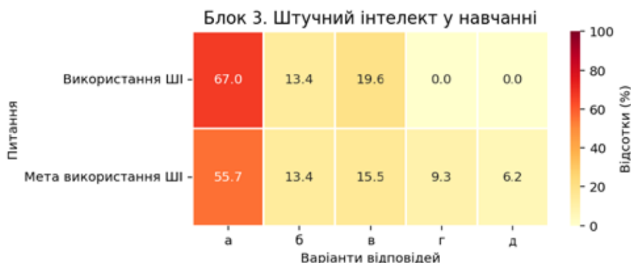
Рис. 3. Розподіл відповідей респондентів щодо застосування штучного інтелекту (ШІ), (Блок 3), (авторська розробка)*

Досліджено рівень інтеграції технологій штучного інтелекту в навчальний процес та специфіку його використання (рис. 3). Більшість респондентів вказали на варіант відповіді «активно користуюсь застосунком ШІ» (67,0%) під час вивчення МБД (див. рис. 3).