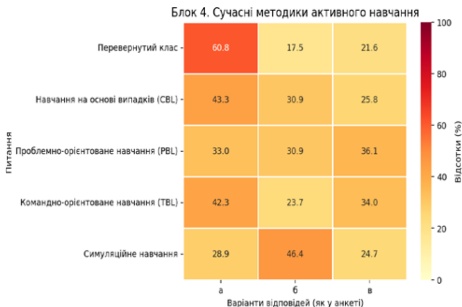
Рис. 4. Розподіл відповідей респондентів щодо застосування сучасних методів активного навчання, (Блок 4), (авторська розробка)*

ного навчання, де засвоєння теоретичного базису виноситься на самостійний етап, звільняючи аудиторний час для практичної діяльності. 60,8% респондентів підтвердили застосування методу FC (див. рис. 4, відповідь «а»). Проте, 21,6% опитаних респондентів вказали, що під час навчання використовують такий метод «перевернутий клас» (FC) ситуативно «рідко», а 17,5% зазначили повну відсутність цієї практики (див. рис. 4, відповіді «в», «б»).