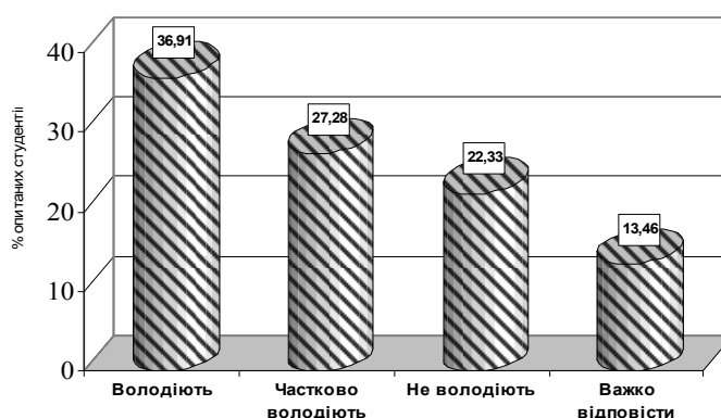
Рис. 2. Результати відповідей опитаних студентів щодо володіння навичками складання анімаційних програм, заснованих на таких видах рухової активності: оздоровчий фітнес, рухові, рекреаційні, спортивні ігри, заняття силової спрямованості, аквааеробіка (%).

Розглянемо більш детально відповіді студентів на наведене вище запитання (табл. 1).