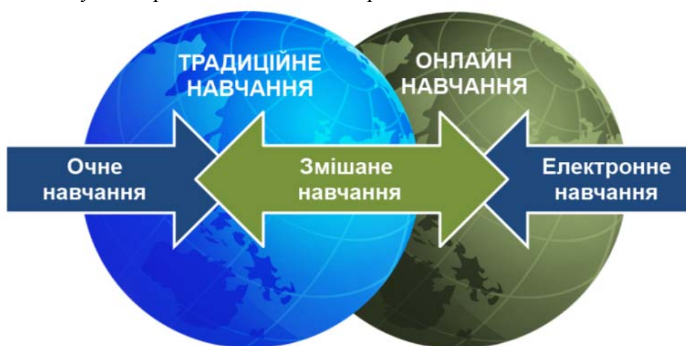
Рис. 1. Структура змішаного навчання.

Визначені компоненти функціонують у постійному взаємозв'язку, утворюючи єдине ціле. Отже, змішане навчання – це система, складові якої гармонійно взаємодіють за умови грамотної методичної організації.